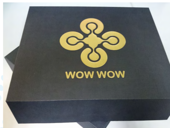
圖 3. 產品成果圖 (3)